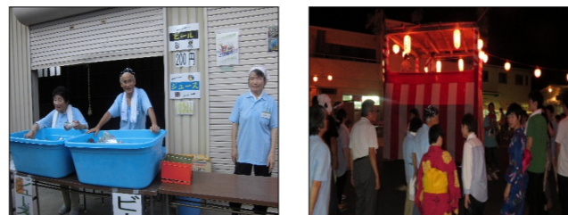
おそくまでありがとうございました